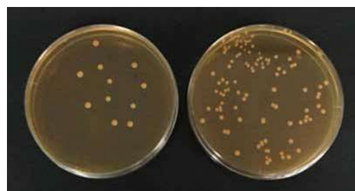
左：添加菌数0個 右：添加菌数100億個 ※対象コロニー：Lactobacillus plantarum