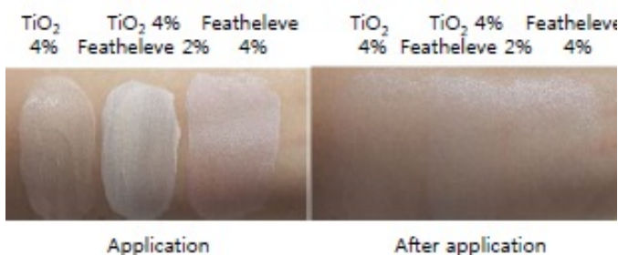
図3. BBクリームに酸化チタン、Featheleveを配合し、皮膚に塗布した様子