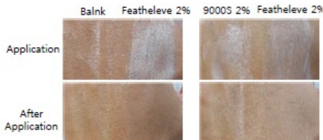
図4. クリームに酸化チタン、Featheleve、を配合し、皮膚に塗布した様子