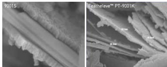
図2. 合成マイカベースのパール顔料(左)と Featheleve(右)の断面図